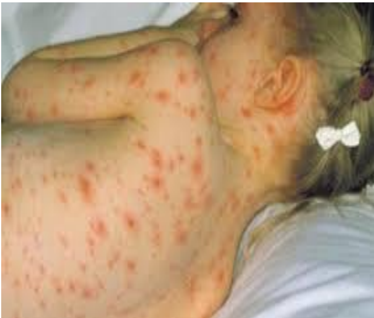
Slika 2: Osip

Ako uočite navedene simptome bitno je nazvati nadležnog liječnika i obavijestiti ga o dolasku kako bi se takva osoba smjestila u zasebnu prostoriju tzv. izolaciju kako zbog velike zaraznosti ne bi proširila bolest i na ostale osobe.