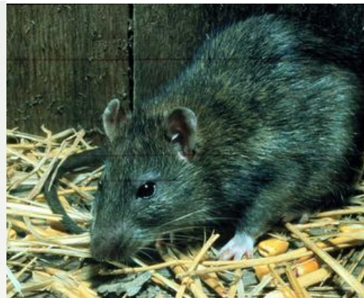
Sl.3 Crni štakor