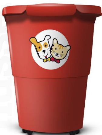
Sl.9 Spremnik za hranu sa poklopcem