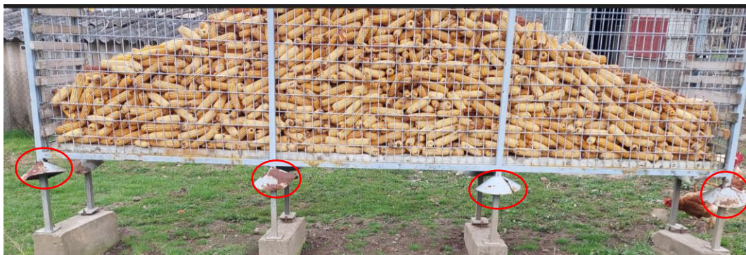
Sl.8 Limeni tanjuri obrnuto položeni na stalcima kukurušnjaka (označeni crvenom bojom)