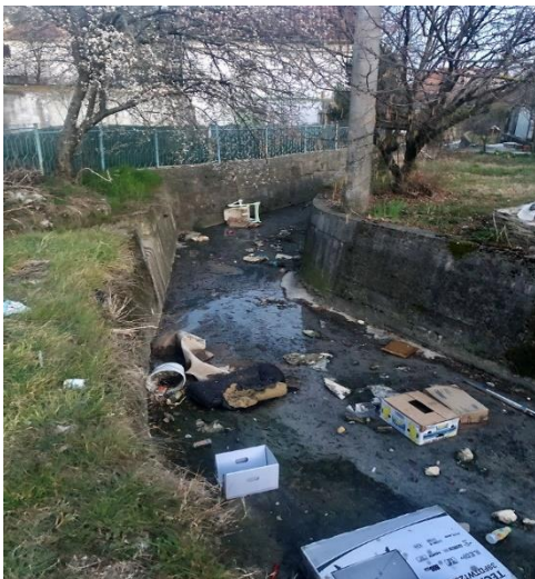
Sl.3 Otpad u tekućoj vodi