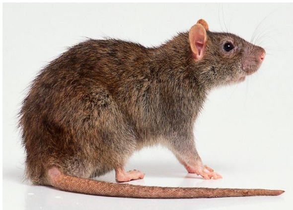
Sl.2 Smeđi štakor