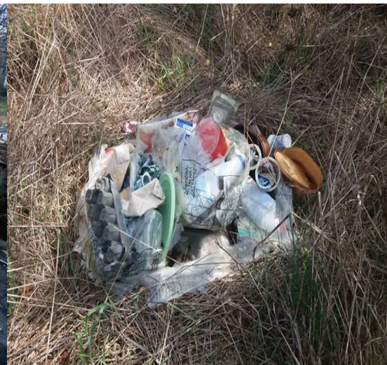
Sl.4 Kućni otpad