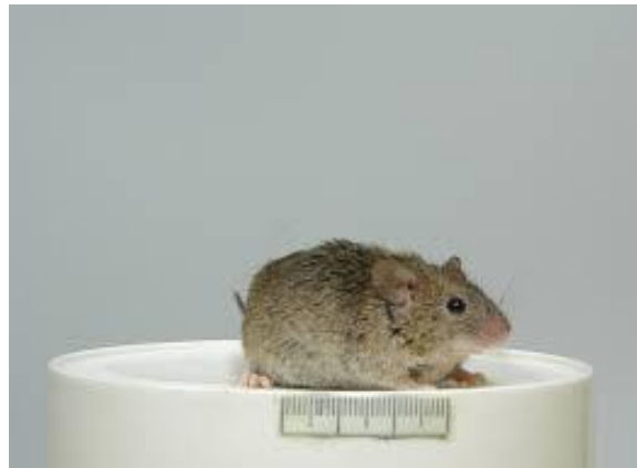
Sl.1 Kućni miš

Glodavci koji su od zdravstvenog značaja i koji najčešće žive u neposrednom okolišu ljudi su kućni miš i štakor (smeđi i crni). Ovi glodavci su najaktivniji u proljeće (zbog potrage za svježom hranom i vodom) i u jesen (zbog skupljanja „zimnice“ za sebe i svoju mladunčad). Tijekom zime, s obzirom na to da nemaju sposobnost samoregulacije svoje tjelesne temperature, uglavnom miruju i nalaze topla i skrivena mjesta i često žive u većim ili manjim zajednicama. Ljeti izlaze samo ako su žedni do bilo kakvog izvora vode. S obzirom na to da su svejedi ne biraju vrstu hrane, ako im je dostupna i „ponuđena“. S obzirom na to da su to uglavnom plahe životinje, aktivnije su tijekom noći, ali ako su u velikom broju i gladuju ili su bolesne moguće ih je vidjeti tijekom dana. Kreću se najčešće „utabanim“ stazama uz rubove zidova i nastambi.