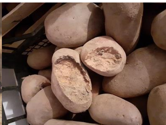
Sl.7 Štete na uskladištenom krumpiru