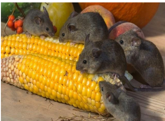
Sl.6 Štete na kukuruzu