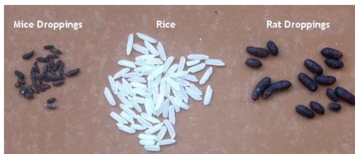
Sl.5 Usporedba veličine izmeta miša, zrnca riže i izmeta štakora

Glodavci tijekom svoje aktivnosti ostavljaju vidljive tragove poput izmeta, nagriženih predmeta i hrane, aktivne rupe i sl.