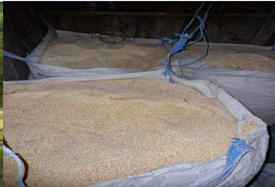
Sl.2 Mljeveni nezaštićeni kukuruz