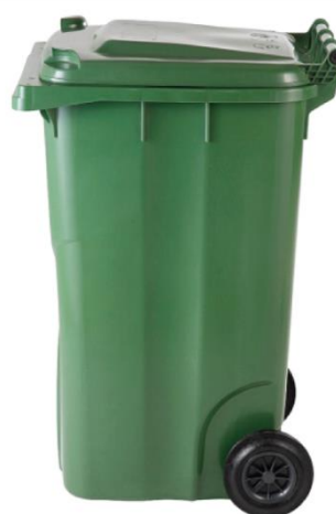
Sl.10 Spremnik za otpad sa poklopcem